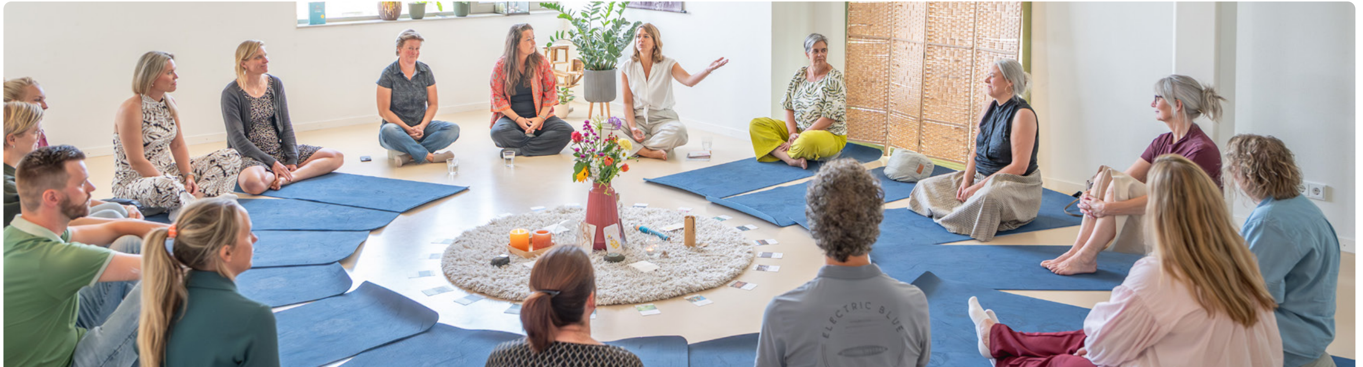
Campus aan De Lanen

Volgens Campus aan De Lanen heeft het onderwijs te veel mannelijke energie en mist er vrouwelijke energie. Die twee dingen moeten meer in balans worden gebracht. Kinderen moeten minder worden afgerekend op bepaalde eisen en meer ruimte krijgen om te ontdekken en ontwikkelen op hun eigen tempo.